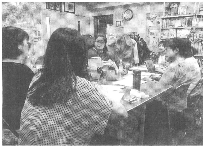
複合差別に関する議論をするDPI女性障害者ネットワークのメンバー